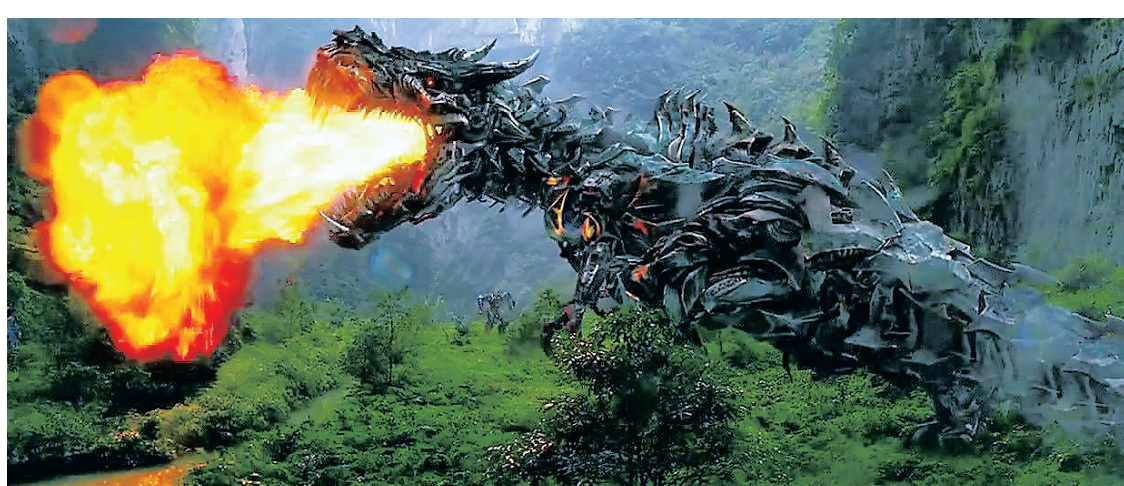
以一亿美元的进账登顶北美周末票房冠军。即六月上映的《变形金刚4:绝迹重生》首映周末,即