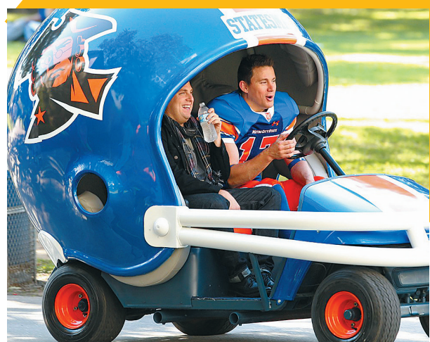
6月上映的喜剧片《龙虎少年队2》成为北美电影票房新贵。图为《龙虎少年队2》拍摄现场。

本报讯 2014年半程已过,美国国内票房依旧是“六家独大”,雄踞美国近九成的市场份额。上半年,美国电影市场总票房达到52.24亿美元,较去年同期小幅下滑1.38%。其中以华特迪士尼公司、华纳兄弟影视娱乐公司、20世纪福克斯电影公司、NBC环球集团、派拉蒙电影公司、索尼影视娱乐有限公司组成的好莱坞“六大”电影公司的票房贡献额为45.21亿美元,占美国市场总票房比例高达86.54%。