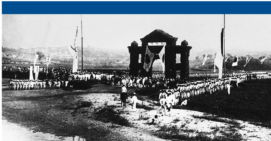
1894年7月29日,侵略日军攻击驻牙山的援朝清军,清军战败。8月5日,日军在朝鲜南部的万里仓搭起了牌楼,举行庆祝牙山战役胜利的阅兵式。

穿越历史硝烟的复兴之路 百年艰辛探索复兴之路 不懈追求实现现代化 4500余件甲午战争档案公布 日本如何通过甲午战争窃取钓鱼岛? 欲取而不敢动 《马关条约》割让岛屿 日本战败,窃取归零