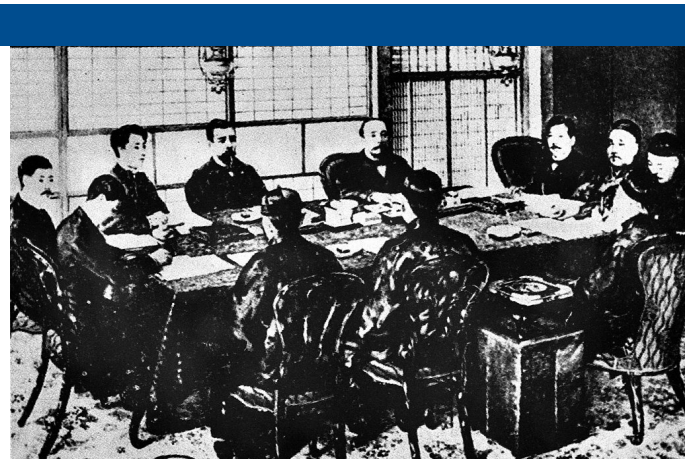
1895年4月17日,中日双方在日本马关春帆楼签订《马关条约》。