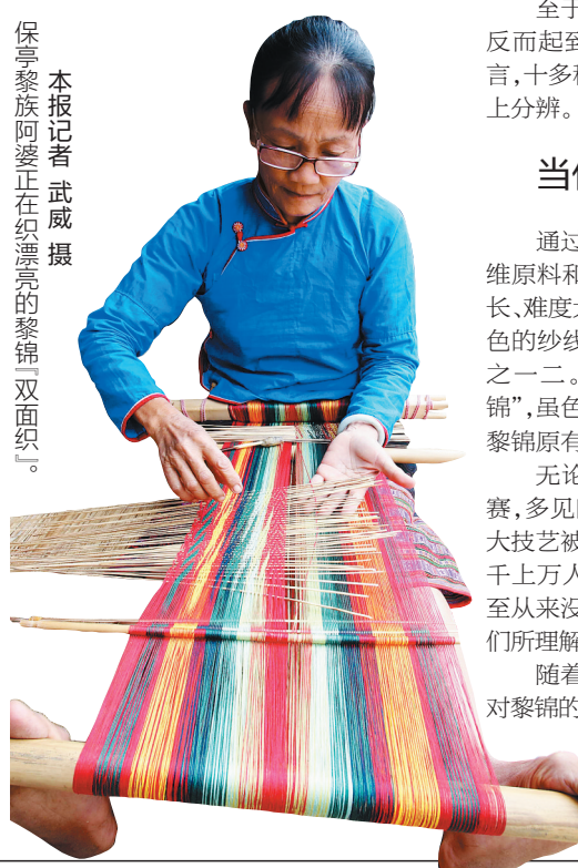
保亭黎族阿婆正在织漂亮的黎锦“双面织”。

“黎锦产业化,先得‘消化’传统黎锦基本特质。正是这些特质使得黎锦既孤独,又充满魅力。”