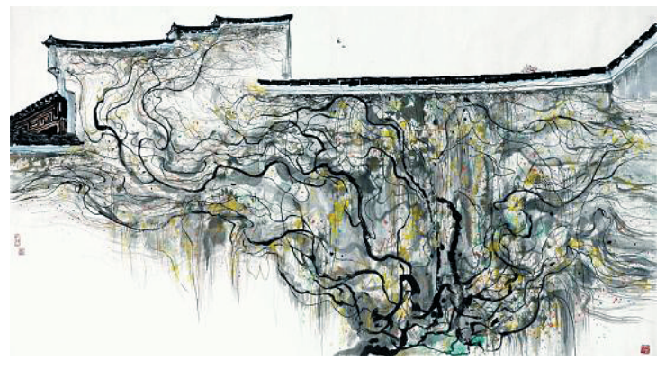
北京匡时2014春拍作品《吴冠中墙上秋色》。