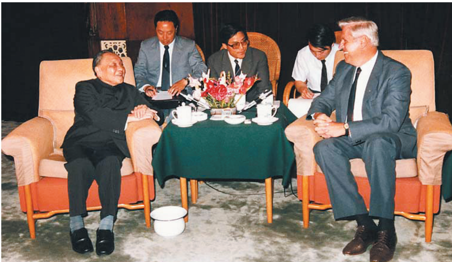
1987年6月12日,邓小平与来访的南斯拉夫共产主义者联盟中央主席团委员斯特凡·科罗舍茨交谈时说:“我们正在搞一个更大的特区,这就是海南岛经济特区。”(资料照片)