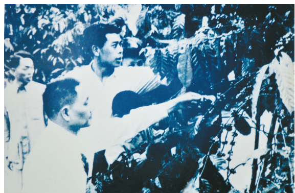
1960年,邓小平视察兴隆华侨农场咖啡园。(资料照片)