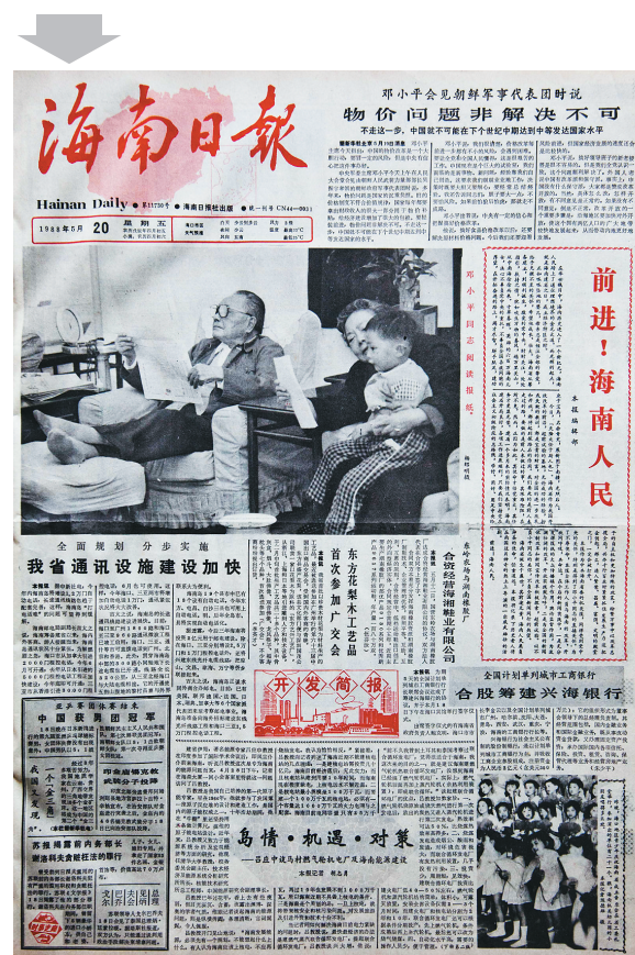
1988年5月20日,海南日报正式启用由邓小平题写的《海南日报》新报头。

邓小平同志是中国改革开放的总设计师,海南建省办经济特区,正是在邓小平同志的倡议、支持和关怀下实现的。1988年4月,《海南日报》报社领导决定抓住难得的发展机遇,以编委会的名义,给邓小平写了一封信,请他为中国最大的经济特区机关报题写报名,这封信通过中共中央办公厅秘书局转给了邓办。1988年5月12日,中央办公厅秘书局寄来了邓小平同志亲笔题写的报名“海南日报”四个大字,刚健有力,潇洒豪放,可当时中央办公厅秘书局在批示中特意嘱托:“请不要发消息,不要登报宣扬。”但社党委仍是按捺不住内心的喜悦和激动,在《社内快讯》上发了喜讯。5月20日,新报头正式启用。