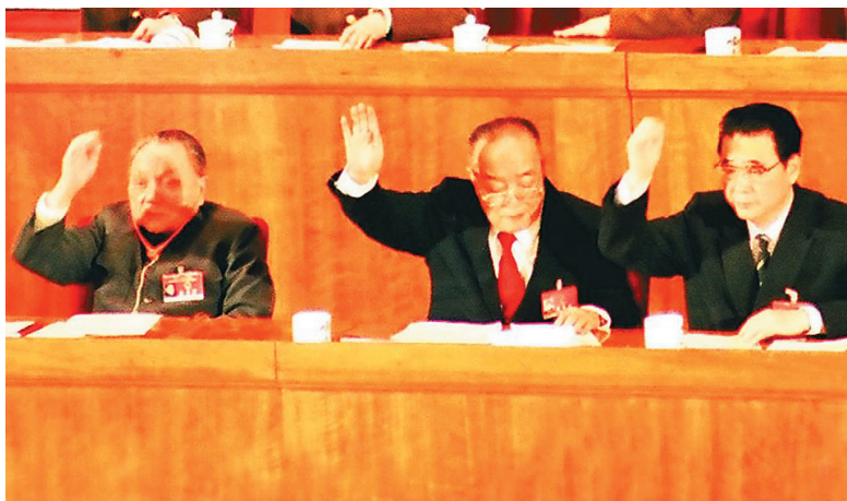
1988年4月13日上午9时35分,第七届全国人民代表大会第一次会议主席台上,邓小平等党和国家领导人庄重地举起右手,表决通过了关于设立海南省的决定和建立海南经济特区的决议。

1987年6月12日,邓小平同志在北京人民大会堂会见南斯拉夫共产主义者联盟中央主席团委员斯特凡·科罗舍茨一行时说:“我们正在搞一个更大的特区,这就是海南岛经济特区。”他向客人介绍海南时如数家珍:“海南岛和台湾面积差不多,那里有许多资源,有铁矿、石油,还有橡胶和别的热带、亚热带作物。”他进而说道:“海南岛好好发展起来,是很了不起的。”正是这段谈话,第一次向世人透露了建设海南大特区的宏伟战略,也成为海南建省办经济特区的发源。27年过去了,在这项战略决策的指引下,琼州大地已经发生了沧桑巨变。