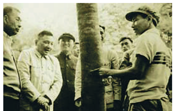
1960年,邓小平在海南农场参观。(资料照片)