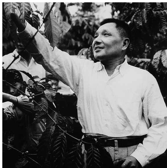
1960年初,邓小平腿伤康复期间到海南岛视察工作,在兴隆华侨农场采摘咖啡豆,杨绍明拍摄了这张照片并取名《喜摘咖啡豆》。(资料照片)

1960年1月29日到2月2日,时任中共中央总书记、国务院副总理的邓小平和中央政治局委员彭真、李先念等,乘机抵达海南岛南端的三亚。第二天,邓小平在中南局第一书记兼广东省委第一书记陶铸等陪同下,来到海军榆林军港视察,欣然登上猎潜艇驶向外海巡视。下午,邓小平视察鹿回头农场,并看望了世代代居住于此的黎族群众。邓小平此次视察海南,从三亚由南向北,先后前往万宁、琼海、海口等地考察。