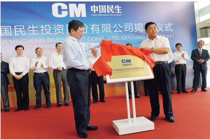
8月21日拍摄的中国民生投资股份有限公司揭牌仪式现场。

中国民生投资股份有限公司21日在上海挂牌。国务院批复、59家民企发起、500亿元注册资金、首家“中字头”民营大型投资公司，不凡的身世使其甫一诞生即广受关注。 这家被称为“民营版中投”的大型投资公司，能否实现社会对它的多重期待？民营资本面临的“玻璃门”能否大举突破？对过剩产业的整合能否顺利实现？又能否使更多民营中小微企业获益？