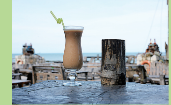
博鳌滨海酒吧公园。