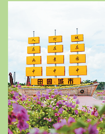
琼海龙寿洋万亩田野公园。