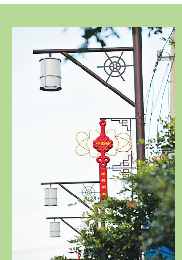
潭门南海渔业小镇。

这是幸福而又浪漫的三天两晚：自驾车队从博鳌小镇出发，一路经过博鳌滨海大道、潭门大桥，游览潭门南海渔业小镇、博鳌小镇、龙寿洋国家农业公园、塔洋古邑小镇、七星伴月景区、万泉水乡小镇……与琼海纯美的田园风光来了一场浪漫的美丽邂逅，每到一地，大家纷纷用相机、摄像机记录下琼海的美丽，第一时间在朋友圈里与更多的自驾车友们分享。