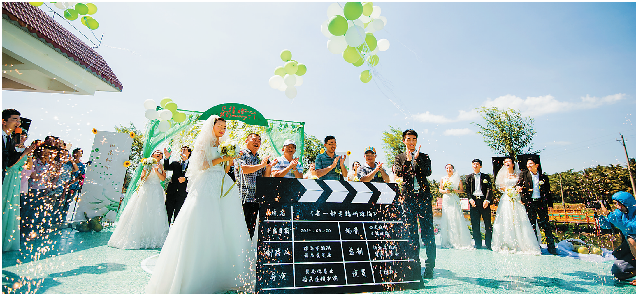
情侣们体验“有一种幸福，叫琼海”创新婚纱摄影。