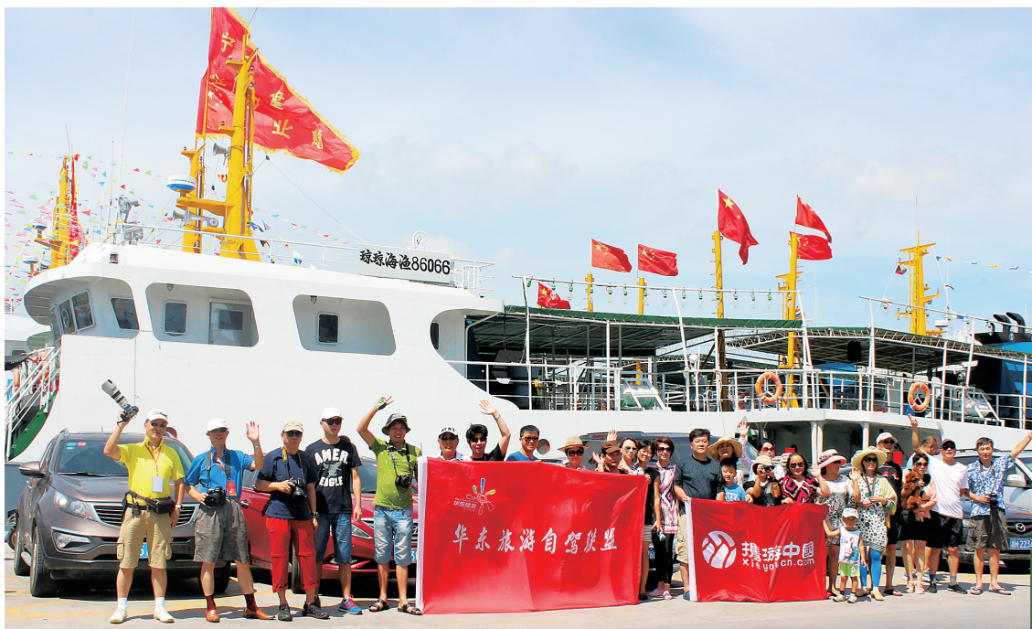
华东自驾游车友感受潭门风情。

游委联合浙江电视台，以及浙江自驾车协会、华东自驾联盟等共同推出“幸福琼海 让爱回家”自驾活动，十辆辆打着“幸福琼海 让爱回家”LOGO的自驾车从浙江出发，一路向南，不但成为沿途的一道美丽风景，也成了琼海一个流动的旅游宣传站。“在移动互联网时代，眼球经济、粉丝经济大行其道，我们希望通过旅拍、邀请网络大咖、组织自驾车队等新方式，更好地展现琼海的旅游资源，尤其是旅游新业态和旅游新产品。”琼海市旅游委表示。