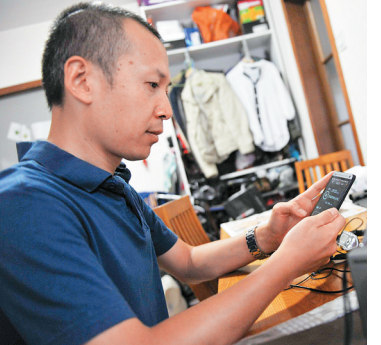
家住北京市朝阳区的乔先生因受到“黑广播”干扰，导致北京体育广播无法正常收听，他不得已改成用手机通过网络在线收听广播。