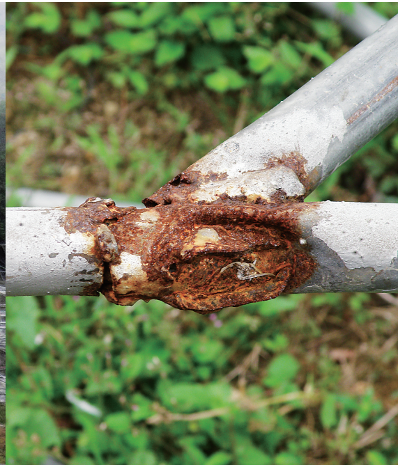
许多建成不久的大棚钢管已锈迹斑斑。