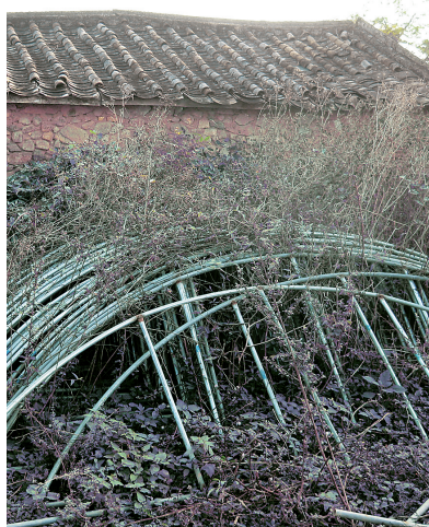
不少大棚业主虚增面积套取补贴。图为某县大棚业主为应付审计, 临时找来的一些大棚材料。

中部某县一公司为了多拿补贴, 虚假注册7个合作社, 将所建的659亩大棚拆分纳入合作社申报, 超额领取补贴467万元。