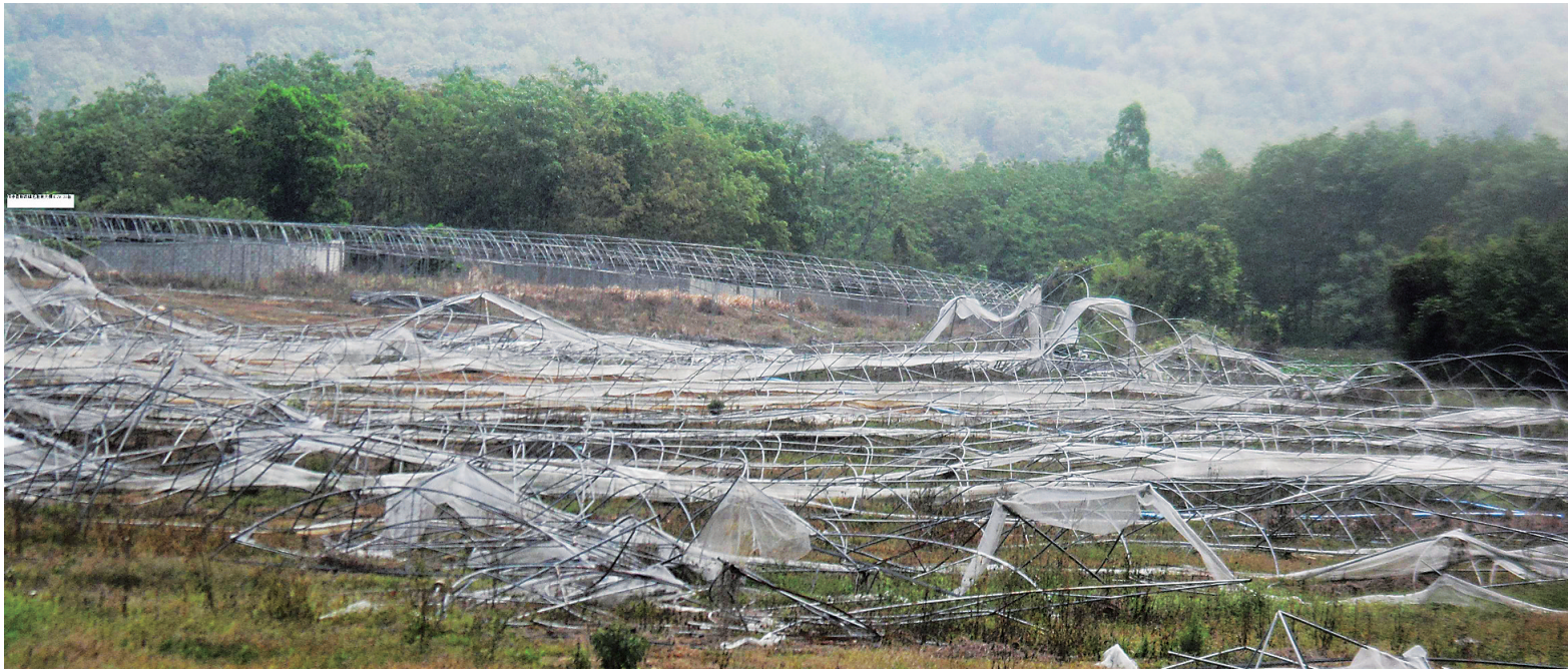
保亭一大棚基地因偷工减料被台风一吹就塌。