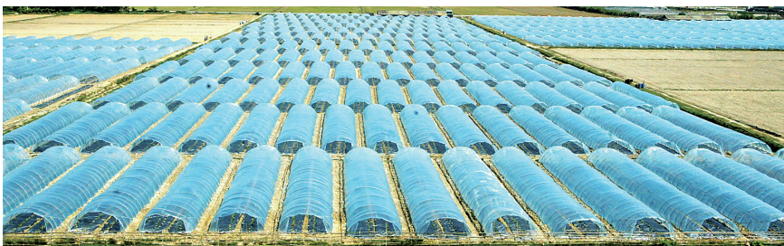
大棚补贴真正落实到位, 才能有效促进产业发展。图为海口市桂林洋农场一西瓜种植大棚基地。

台湾专家林俊昇表示, 大棚资金补贴, 政府可以尝试组织农户共同建设。也可以借鉴台湾的模式, 政府建设, 然后出租给农户种植, 这样既可以保证资金不被套取, 大棚不会被闲置, 也可以让更多农户得到好处。