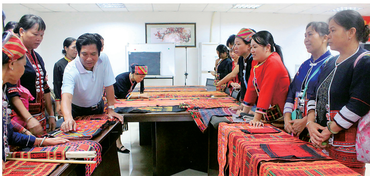
9月11日,黎族传统纺织图案研讨班现场。