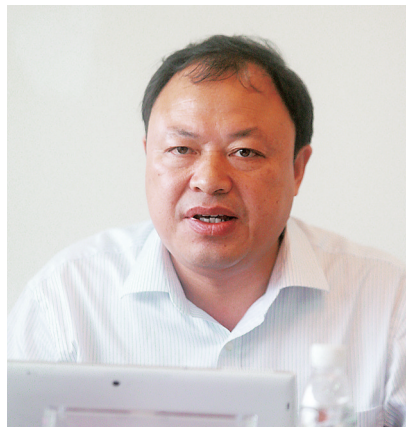
党的十八届四中全会强调“深入推进依法行政，加快建设法治政府”，指出“法律的生命力在于实施，法律的权威也在于实

施”，行政执法是把纸面上的法律变为现实生活中活的法律的关键环节，依法行政是依法治国的关键。