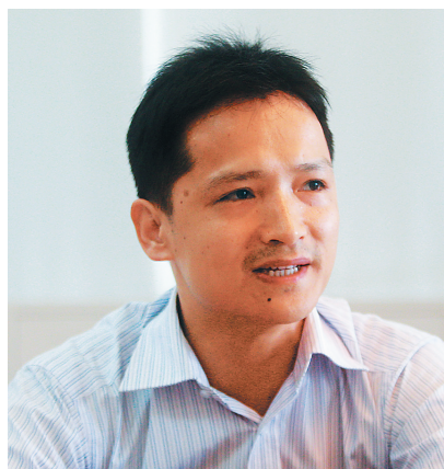
依法治国是一项系统、复杂、庞大的工程，涵盖立法、执法、司法、守法多个层面。立法、执法与司法在依法治国的推进中国

然处于核心地位，但是守法的重要性也毋庸置疑。有鉴于此，十八届四中全会《决定》除了对立法、执法和司法提出明确的指示之外，还特别作为第五点提出要“增强公民法治观念，推进法治社会建设”，这是《决定》对公民守法所作出的明确要求。