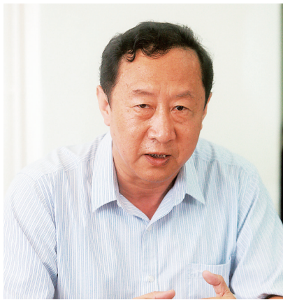
的，这表明我们建设法治国家是全面的建设，同时，既注重持续性，又注重解决当下最关注的问题。

第四，用法治思维、法治方法推进基层治理法治化，从从严治军，保障“一国两制”实践和推进祖国统一，涉外法律工作。这是我们当前法治建设的重点领域，《决定》予以突出强调，这是以往所没有