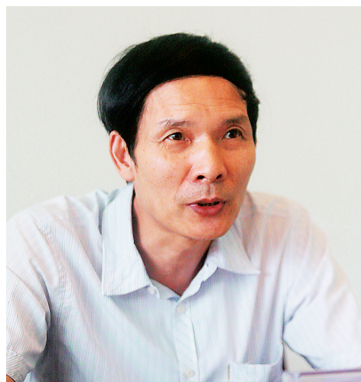
十八届四中全会通过的《决定》紧密结合我国改革发展的实际需要，提出了立法工作的奋斗目标、指导思想和主要措施，发

展完善了中国特色的立法理论和体制机制。《决定》强调“法律的生命力在于实施”有着特殊意义，这不仅是对法律实施的要求，也是对立法质量的基本要求，要求我们制定的法律法规要适用、好用、管用。