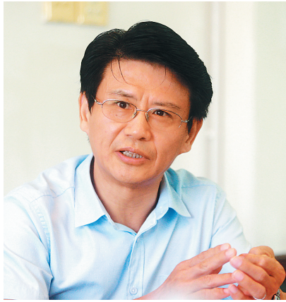
线不可触碰，必须带头遵守法律和依法办事，决不能违法行使权力，更不能以言代法、以权压法、徇私枉法。

三、推进全民守法的关键是党员特别是党员领导干部的率先垂范和以身作则。党员是人民群众中的先进分子，党员领导干部在社会运行秩序中居于组织者、指挥者、决策者地位，他们的遵纪守法行为，对其他社会民众的心理心态、价值判断及行为方式将产生几何级数的正面影响；同样，他们的违法乱纪行为所生产的负面影响，也将是呈几何级数增长的。因此，推进全民守法，首先应当是党员和领导干部守法。党员领导干部必须敬畏法律，必须牢记法律红线不可逾越，法律底