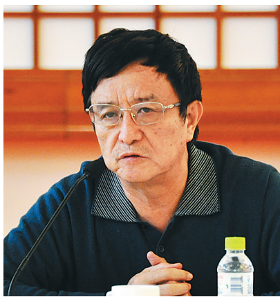
党委领导政法工作的组织形式，必须长期坚持”，等等。这些都是对党的领导和依法治国关系的正确厘清。

全面推进依法治国和党的领导是什么关系？习近平总书记指出：“党领导人民制定宪法和法律，党领导人民执行宪法和法律，党自身必须在宪法和法律范围内活动，真正做到党领导立法、保证执法、带头守法。”这说明，党的领导和依法治国高度统一。《决定》提出了依法治国五项基本原则：坚持党的领导，坚持人民主体地位，坚持法律面前人人平等，坚持依法治国和以德治国相结合，坚持从中国实际出发。《决定》对党的领导、人民当家作主和依法治国的有机统一原则作出了具体化规定，比如，“加强党对立法工作的领导，完善党对立法工作中重大问题决策的程序。凡立法涉及重大体制和重大政策调整的，必须报党中央讨论决定”，再比如，“把拥护中国共产党领导、拥护社会主义法治作为律师从业的基本要求”，政法委的职能是