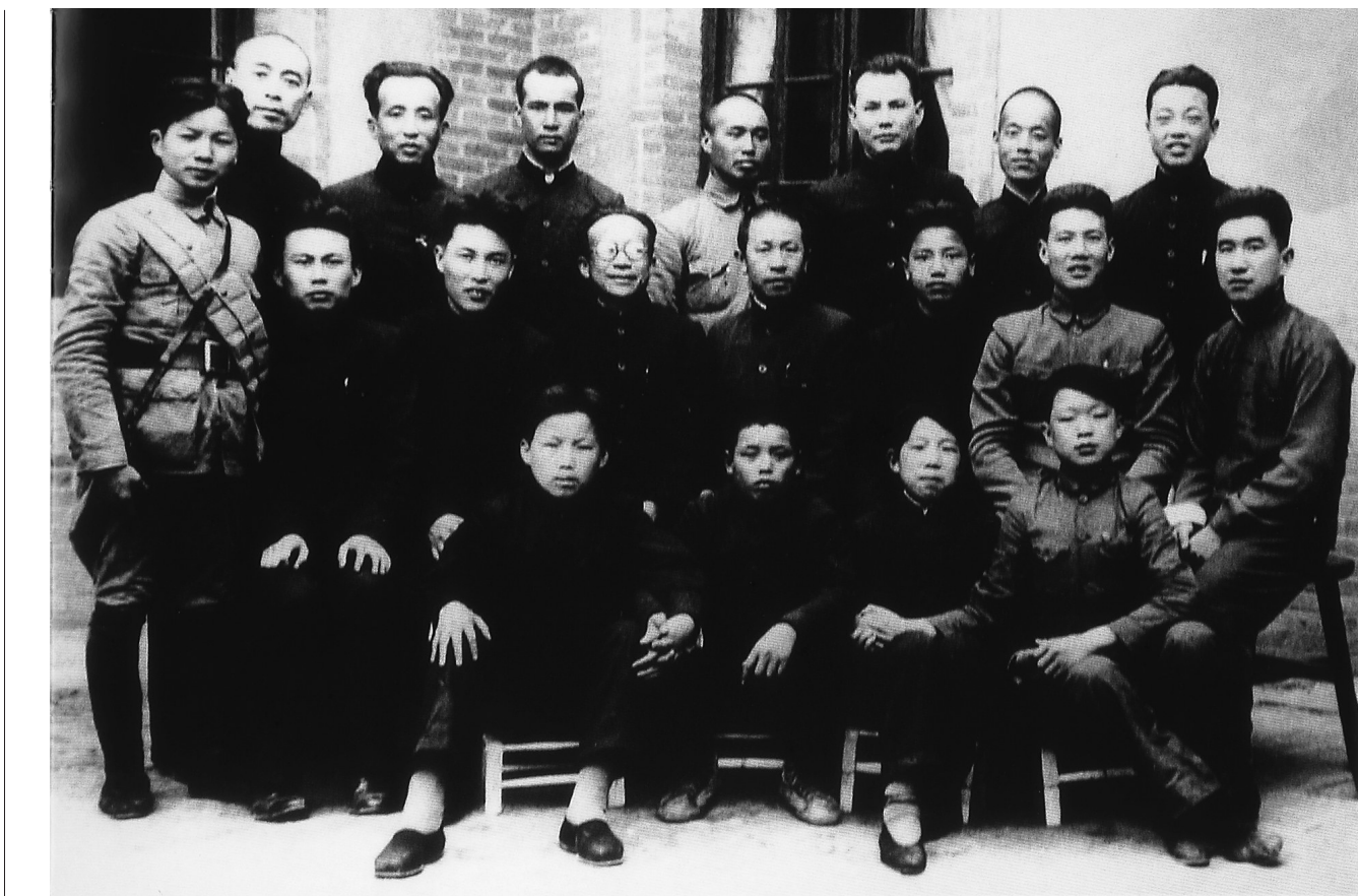
1937年5月,张云逸(二排左四)、云广英(后排左二)、林青(二排左二)等人在西安的合影。后排左一为周恩来。

“更喜岷山千里雪,三军过后尽开颜。”在中国革命史上,二万五千里长征是波澜壮阔的历史,也是壮丽的诗篇。在这壮阔的史诗中,也有琼崖革命的火种闪耀。