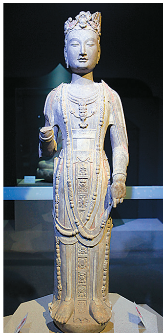
北齐贴金彩绘观世音菩萨立像。