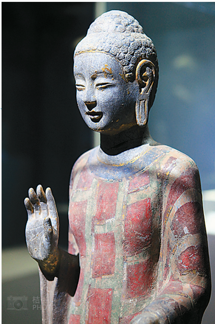
青州博物馆收藏的石雕造像历史悠久、精美绝伦，让人叹为观止。图为北齐贴金彩绘石雕释迦像。