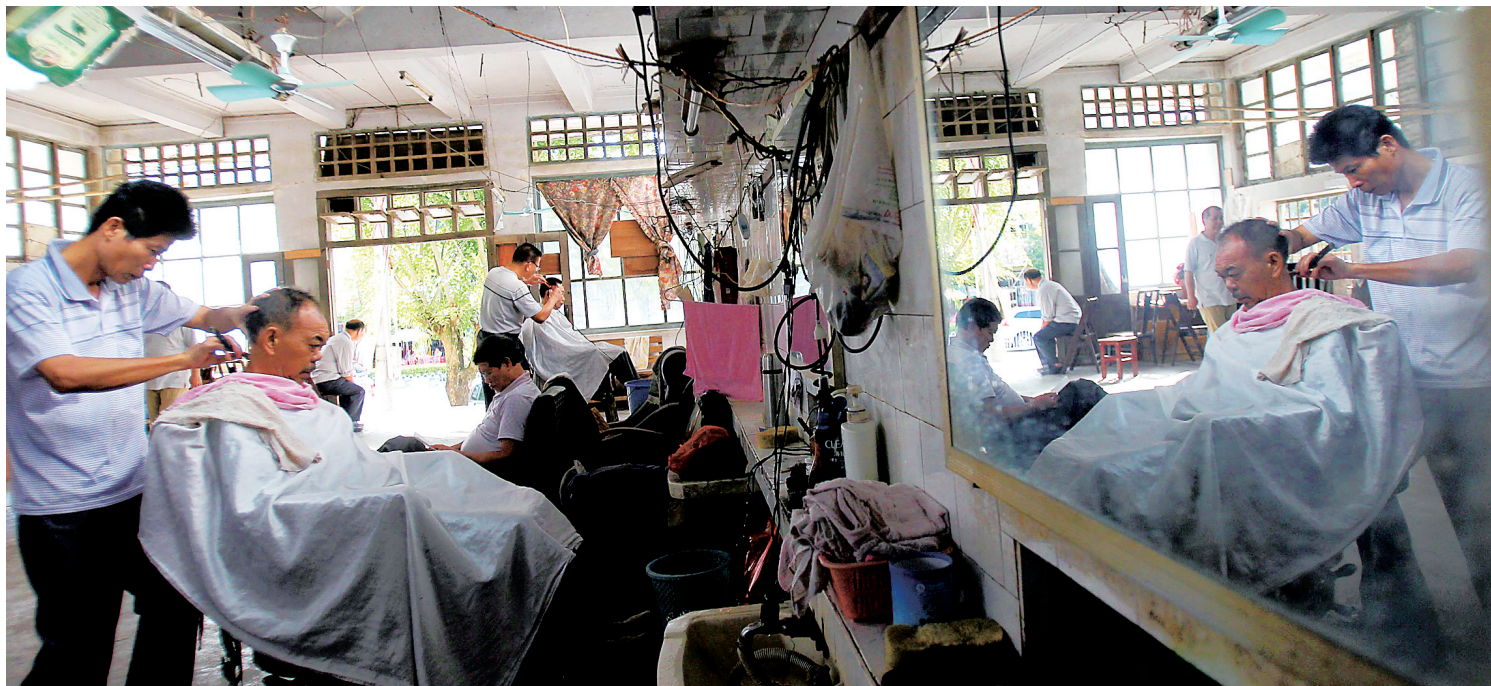
老式理发店几十年如一日地为老街坊们服务。

在琼中县城营根镇，有一家已有53年“高龄”的理发店——简陋的设备，与时代脱节的装饰，戴着老花镜的剃头师傅，似乎成了老式理发店的“标配”，有人为技艺而来，有人为习惯而来，有人为怀旧而来。