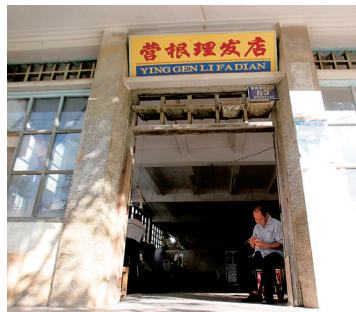
身处闹市的营根理发店门面老旧，显得有些突兀。

它虽然没有现代理发店、美容店的高档与华美，却坚守着几十年的宁静和质朴。营根理发店