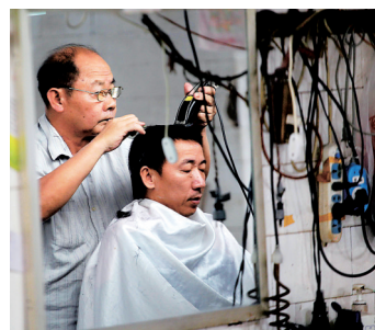
理发店的老师傅们技艺纯熟，深受老客信赖。