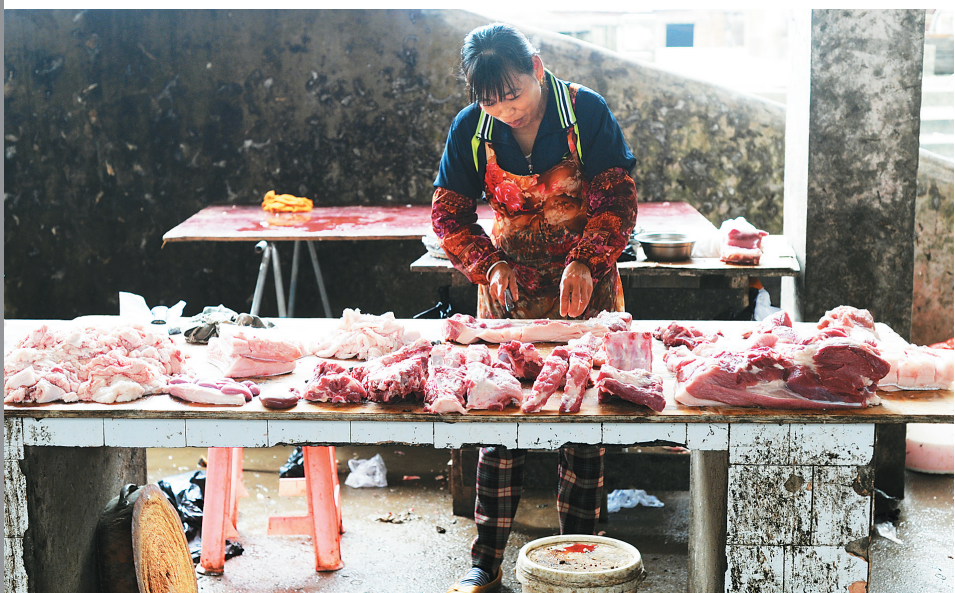
农村农贸市场卖肉的案板多是黑乎乎脏兮兮的,猪肉多无检疫部门的印章。