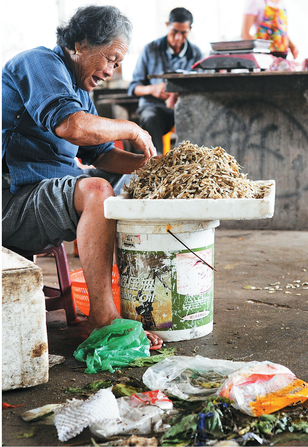
农村食品市场现状,图中为垃圾遍地的某村农贸市场。

情况确实如此。一家藏身农村的非法食品加工点被查处时,老板就说:“城里生意越来越不好做了,农村人没那么讲究,销路不成问题,执法部门查得也不严,生意还算好做。”