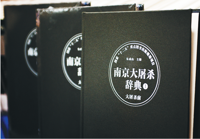
图为《南京大屠杀辞典》(第一卷)。

今年12月13日是我国首个南京大屠杀死难者国家公祭日。7日，由侵华日军南京大屠杀遇难同胞纪念馆、侵华日军南京大屠杀史研究会和南京出版社，共同来自中国第二历史档案馆等众多科研与档案部门，以及日本、美国、俄罗斯、德国等10余个国家的60多位专家学者参与，共同编撰而成的《南京大屠杀辞典》。