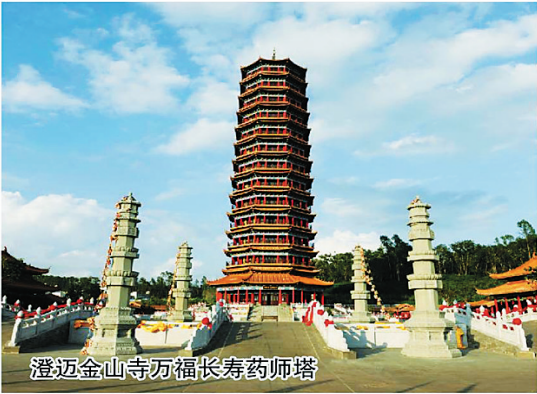
澄迈金山寺万福长寿药师塔

处于市中心,占据澄迈金江镇发展咽喉要地,靠近澄迈大桥,侧面可看到金山寺,海南最高的佛塔——金山寺万福长寿药师塔宏伟壮丽佛光普照,依山伴水,是金江镇的稀缺黄金地段,度假、休闲、养生首选之地。周边居住片区业态成熟,生活配套设施齐全,是澄迈金江县城综合性发展的潜力板块。 该地块总计118.5亩,其中居住用地72.45亩,商业服务业用地46.05亩。周边交通环境四通八达,路况较好,区位便利条件优越。拟采用前段开发临江商铺商业街,后段开发住宅小区、江景房或酒店相结合的开发方式,有利于商业气氛的营造和城市活力的激发,内河江景绝唱,商机不可多得。