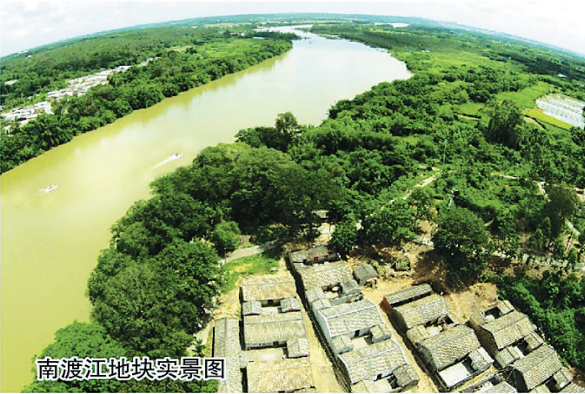
南渡江地块实景图

江水,灵动而富有生命力。流经世界长寿之乡的南渡江澄迈金江段,更是集聚天地之精华,汇聚人间之福气的上风上水所在。 伫立江边,红身金檐的金山寺映入眼帘,熠熠生辉;沿江漫步,滚滚而至的江水、舒爽清透的江风,能濯清人世间种种烦闷。 地产界常说:水能淌金。由于“水景”资源的不可再生和不可复制,“水景”房概念往往能成功点“房”成金。“城有水则秀,居有水则灵”,不论地产风云如何诡谲变幻,作为城市重要风景线的江景,直观体现城市的人居品位,扼守价值洼地,更具楼市“硬度”,颇受市场优待。 今年7月,澄迈首开全省内河航运旅游之先河,