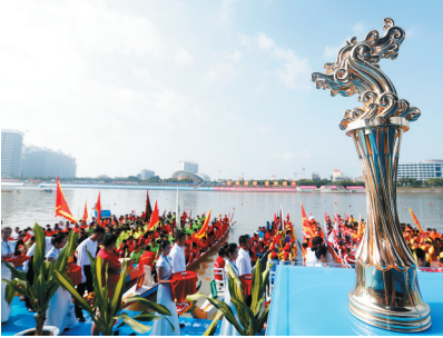
12月7日，2014年中华龙舟大赛总决赛开幕式。