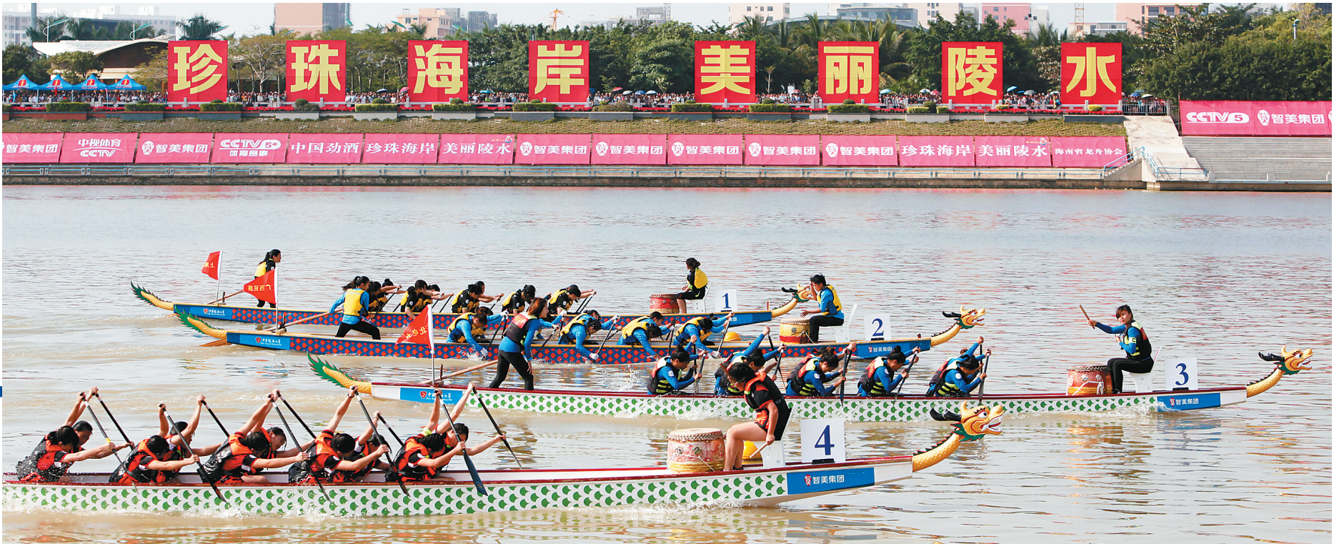
十二月七日，二〇一四年中华龙舟大赛总决赛大学生组女子十二人龙舟一百米决赛现场。