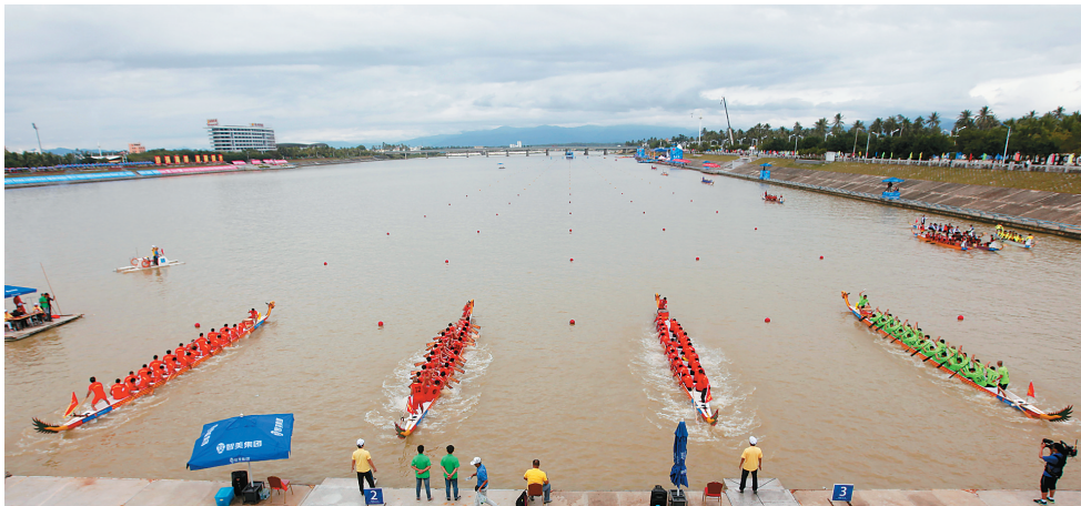
十一月六日，二〇一四年中华龙舟大赛总决赛职业男子组五百米直道比赛现场。