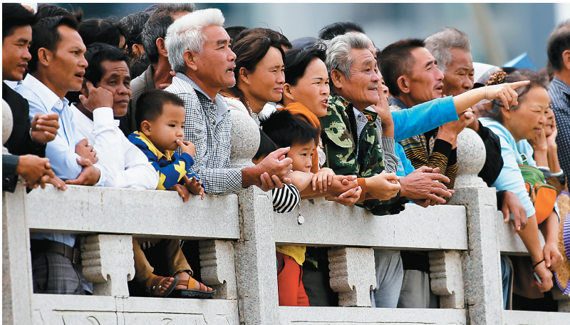
十一月六日，陵水市民兴致勃勃地观看精彩赛事。