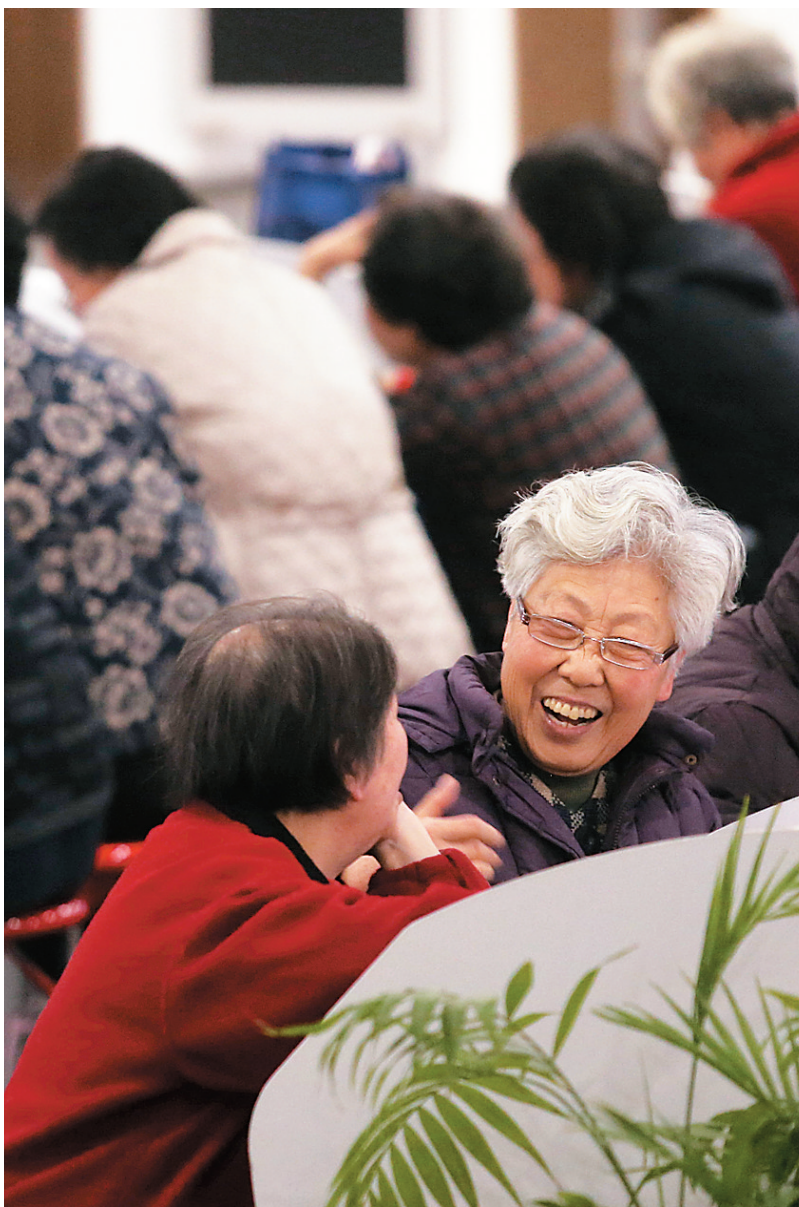
12月8日,股民在上海一家证券营业部内关注股市行情。