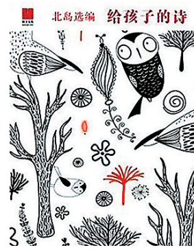
北岛选编 给孩子的诗 适合三岁以上学生 2014年7月出版

著名诗人北岛从自己深厚的诗歌写作和阅读经验出发,甄选了自己心目中最适于孩子阅读的101首中外诗歌,编成了这部特别的诗歌经典选本。这些诗歌涵盖57位不同国别的诗人,时间跨越古今,题材触及爱情和政治,具有极强的地域和时间、美学的延展性,可以让年轻一代读者快速而准确地对世界诗歌有一个印象,也可以以此为线索顺藤摸瓜,找到适合自己阅读的优秀诗人和优秀诗歌。四川在介绍这本选集时曾说,一个从小读威廉·布莱克的《老虎》的孩子会是一个气度不凡的孩子。