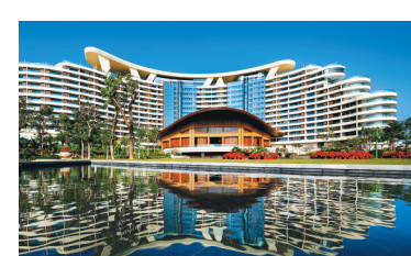
海棠湾天房洲际酒店。