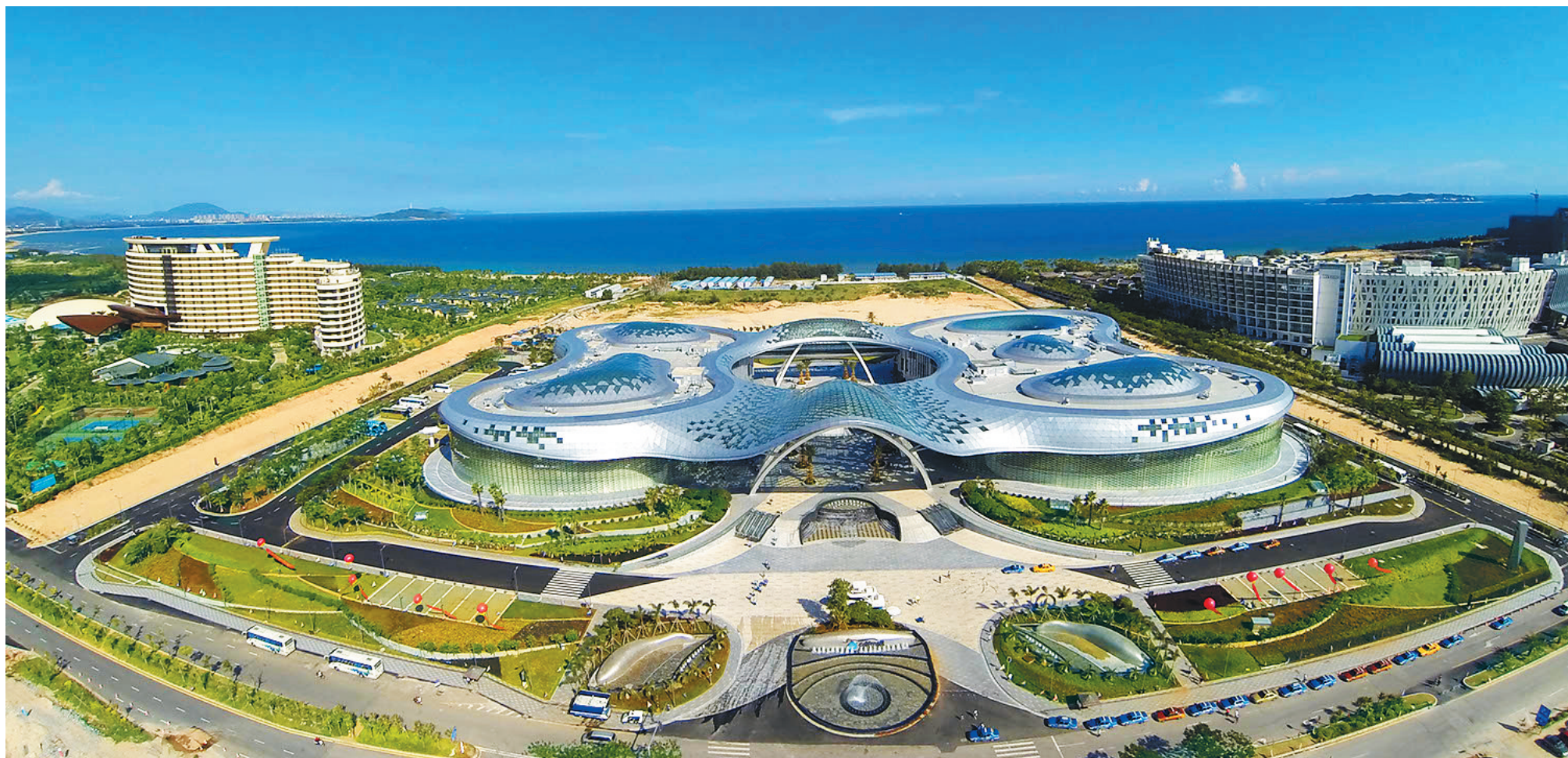
会议天堂——三亚海棠湾。