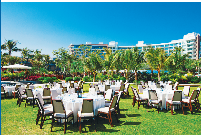
民生威斯汀度假酒店户外草坪宴会。

也许正因为如此，一次又一次的重量级会议，都选择在海棠湾举行，今年4月召开的世界旅游旅行大会(WTTC)也不例外。