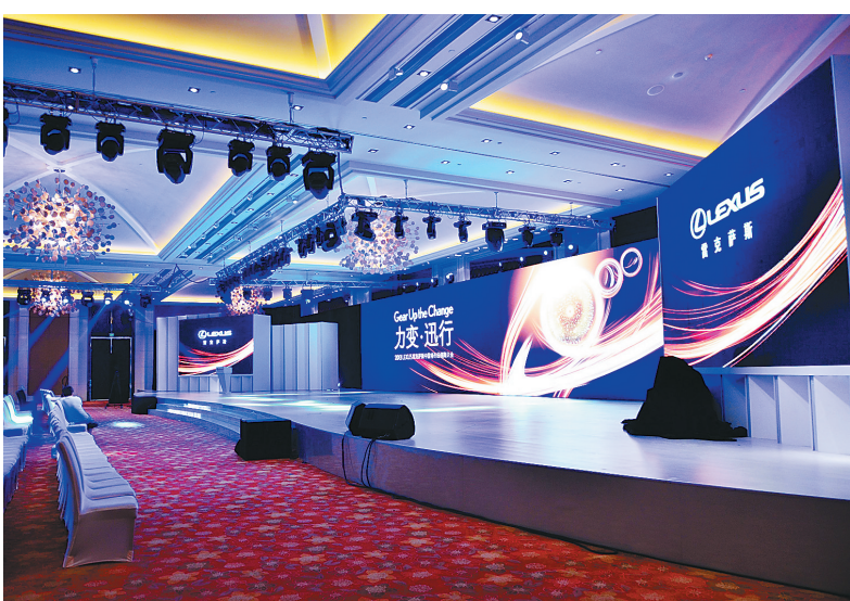
海棠湾喜来登度假酒店会议厅。