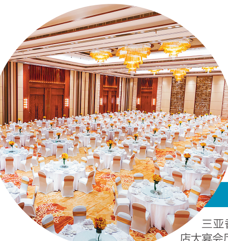
三亚香格里拉度假酒店大宴会厅。

三亚香格里拉度假酒店大宴会厅，拥有各种椰林温泉别墅360间套以及豪华客房128间，3个多功能会议室，中西餐厅和绿色茶吧，SPA美疗及康乐设施一应俱全。(王润 辑)