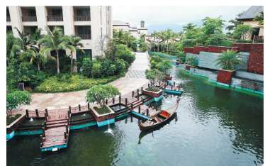
凯宾斯基度假酒店。