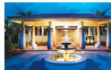
海棠湾豪华精选酒店。