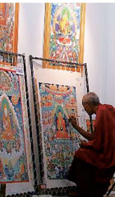
唐卡创作要求创作者必须专注投入