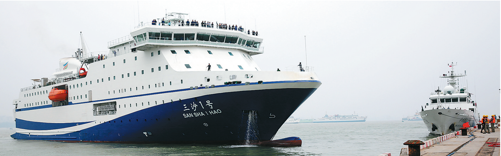
“三沙1号”交通补给船抵达海口港。

三沙市副市长冯文海表示,有关部门将按照时间表加紧做好“三沙1号”的测试、验收工作,加强船员的技术训练和管理培训,为首航做好充分准备。据了解,“三沙1号”将于本月底正式首航,开赴三沙市永兴岛,执行首次补给任务。