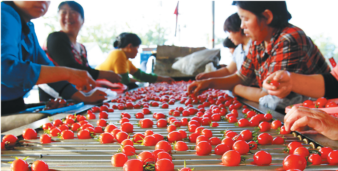
陵水光坡镇武山村佳伟圣女果收购点,工人正在筛选优质圣女果。

据了解,早在2009年,就有台湾客商把目光瞄准陵水光坡镇这块“福地”,引进台湾的优质种苗和种植技术种植圣女果,其出产的圣女果清脆美味,没有普通圣女果的酸涩,一上市就迅速在北京、上海、江浙一带走俏,获得了市场认可,也就是从那时候起,光坡镇开了陵水种植圣女果的先河。 陵水光坡镇镇委委员许连辉回忆说,刚开始,只是有些农户帮助老板打工,种植圣女果,并没有意识到会是收获一笔可观的收入,有群众就试着在老板承包的地块旁学样种植,初尝到甜头。 从2010年起,光坡镇农民开始规模种植圣女果。据陵水农委提供数据,2010年,全县种植面积5000亩,净产值5000至6000元/亩;2011年,种植面积2万亩,净产值6000至7000元/亩;2012年,种植面积3.3万亩,净产值1万元以上/亩;2013年种植面积4万亩,受