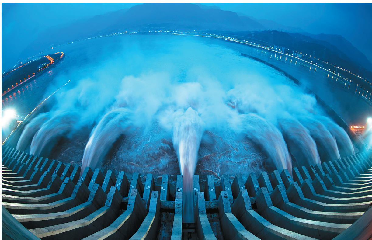
12月14日是三峡工程正式开工建设20周年纪念日,自兴建以来,三峡工程的发电效益显著发挥,累计发电量已突破8000亿千瓦时。其中,2014年度发电量有望创历史最高值,并首次位居世界各水电站之首。图为三峡水利枢纽开启泄洪深孔泄洪。