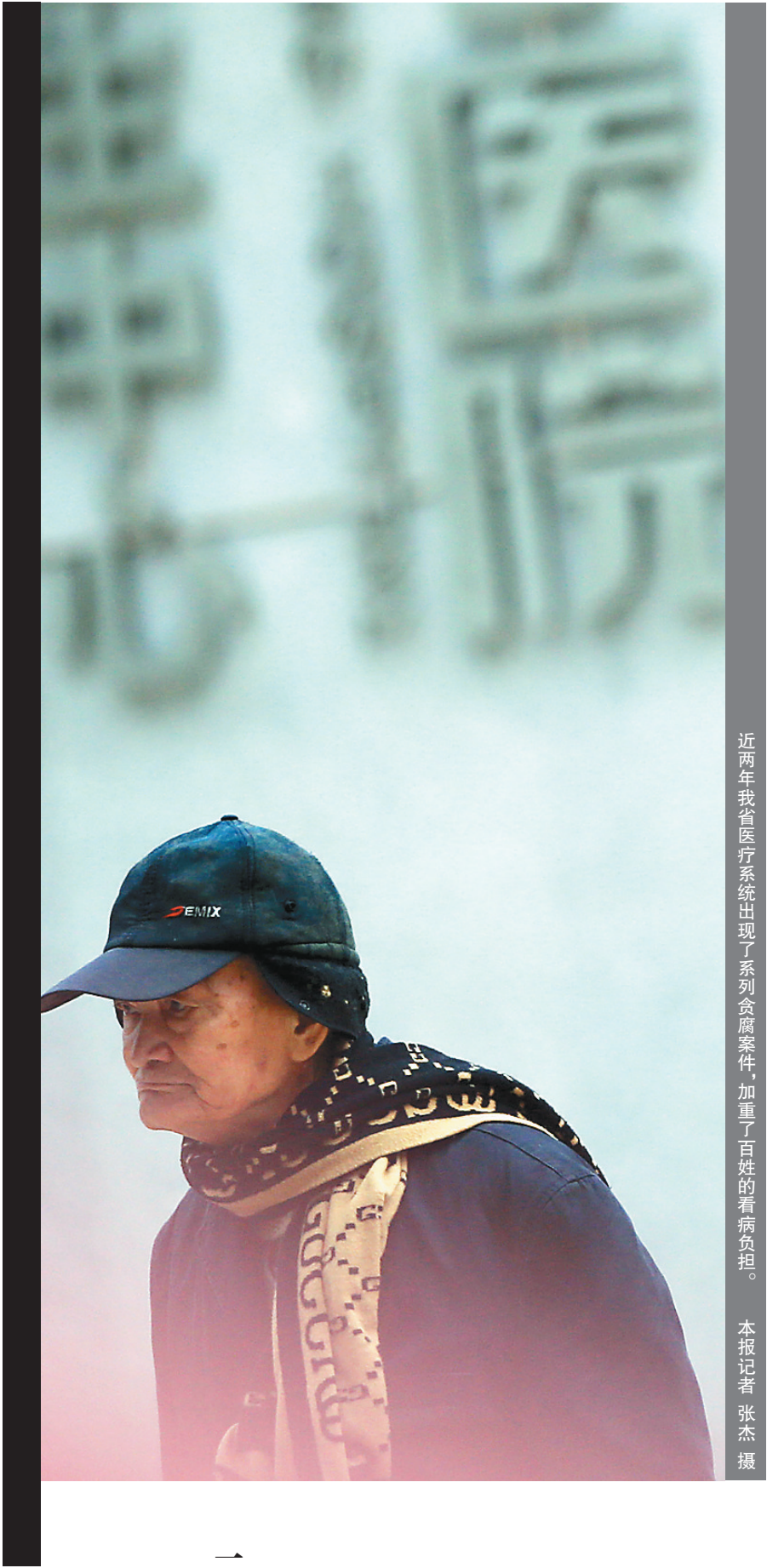
近两年我省医疗系统出现了系列贪腐案件,加重了百姓的看病负担。