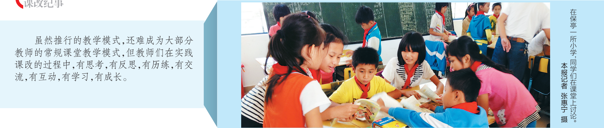
在保亭一所小学,同学们在课堂上讨论。

虽然推行的教学模式,还难成为大部分教师的常规课堂教学模式,但教师们 在实践课改的过程中,有思考,有反思,有历练,有交流,有互动,有学习,有成长。