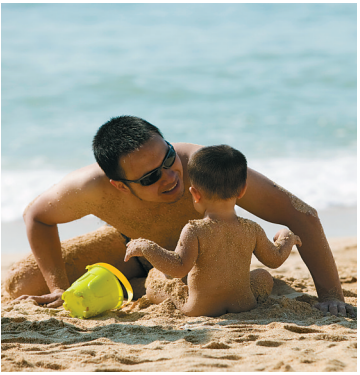
带孩子在大东海玩沙的家长。

保亭课改一晃3年过去了,3年课改收获了什么?虽然推行的教学模式,还难成为大部分教师的常规课堂教学模式,但教师们 在实践课改的过程中,有思考,有反思,有历练,有交流,有互动,有学习,有成长。正是因为进行课堂改革,使得保亭的教学教研有了风雨过后欣欣向荣的景象。保亭课改,虽无花开,但有绿柳,也是春天!