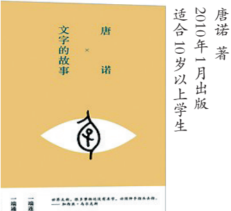
唐诺著 2010年1月出版 适合三岁以上学生

推荐理由: 这本书带我们回到汉字的起点——甲骨文,揭开一个个汉字最初的“身世”,并展现文字意义堆积、延续并负载情感的过程,还力图还原古人的生活,带我们回到文字产生的现场。儿童无疑会喜欢甲骨文,因为每个字亦字亦画,能直观地读出有趣的故事和场景,掌握最初的字意,并在古今对照中获得丰富的启示。唐诺的文章行文优美,没有枯燥的学术味,适合儿童阅读。甲骨文方面的阅读,由浅及深,还可以有诸多延伸,比如流沙河的《白鱼解字》和许进雄的《中国古代社会:文字和人类学的透视》等。