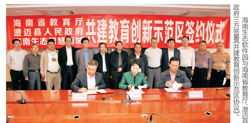
海南生态软件园与海南省教育厅、澄迈县人民政府三方签署共建教育创新示范区协议。

中国游戏产业年会是中国音像与数字出版协会领导下的中国游戏行业交流、合作、展示和交易的重要大会，已经成为中国游戏产业总结经验、分析现状、规划未来的重要交流与平台。 海南生态软件园与中国音像与数字出版协会签署合作协议，双方将在游戏产业招商、游戏产业培育等方面开展全面合作，连续3年在海南举办中国游戏产业年会，推动园区游戏产业集群发展，为园区游戏企业提供交流、合作、展示和交易的平台。 目前，包括腾讯、巴别时代、动网先锋等一大批游戏企业落户园区。其中，今年10月29日腾讯创业基地(海南)正式落户海南生态软件园。建设基地样板，塑造标杆企业。腾讯提供线上服务(如腾讯开放平台)，海南生态软件园提供线下服务，共同孵化和培育游戏等互联网创新创业企业，推动一批游戏企业上市。11月1日当天首批148家游戏互联网企业签约进驻腾讯创业基地(海南)，十天时间签约企业累计超过300家。