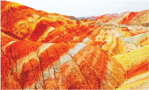
被誉为上帝调色盘的张掖七彩丹霞景区。