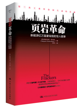
格雷戈里·祖克曼(美) 中国人民大学出版社 2014年10月

六年前美国还在担心石油依赖,六年后美国却即将成为下一个中东,一切都源于页岩气。本书讲述了几位被视为极度投机和疯狂的企业家,如何靠着近乎偏执的创业精神和技术创新,为美国在页岩油气开采方面带来革命性变化和20年来最大的能源变革。