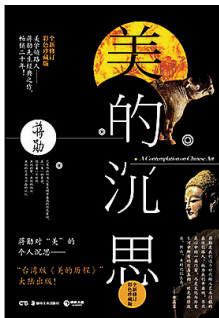
蒋勋著 湖南美术出版社 2014年9月

台湾美学大师蒋勋先生在美学领域的经典代表作。玉石、陶器、青铜、竹筒、帛画、石雕、敦煌壁画、山水画……蒋勋在这些被“美”层层包裹着的艺术作品中,开始逐渐思考起它们形式的意义。经过一次又一次时间的回流,全面梳理中国艺术脉络,以美学视角诠释从上古到明清的艺术之美。