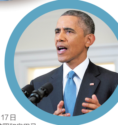
12月17日,劳尔·卡斯特罗和奥巴马分别发表讲话。