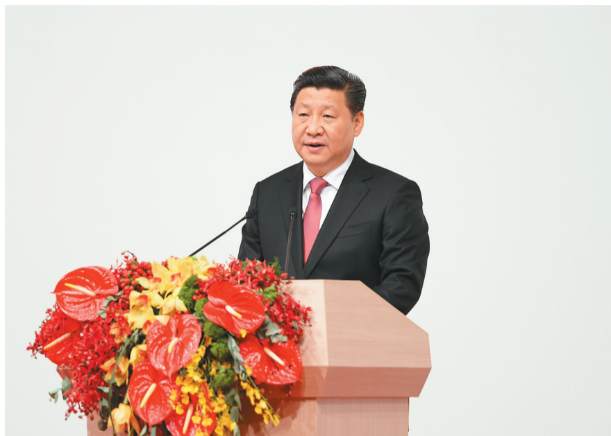
12月20日,庆祝澳门回归祖国15周年大会暨澳门特别行政区第四届政府就职典礼在澳门东亚运动会体育馆隆重举行。中共中央总书记、国家主席、中央军委主席习近平出席并发表重要讲话。