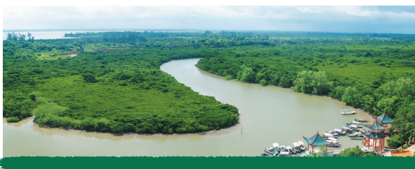
海口东寨港红树林湿地风光。