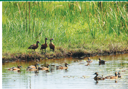
昌江海尾湿地公园的野生栗树鸭。