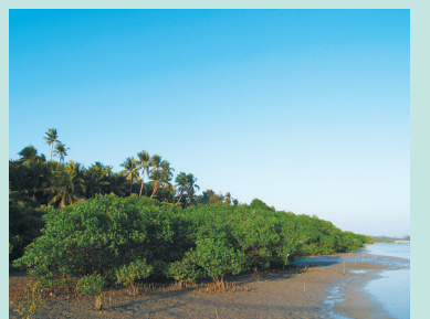
文昌清澜港一带的湿地。