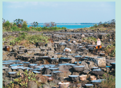
洋浦盐田湿地景观。