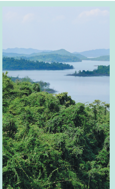
儋州番加省级自然保护区。卢刚 摄

这里自然植被、半自然植被和人工植被覆盖率达到89.9%。青皮林、红树林等珍贵树种和丰富的植物, 广泛分布在山岭、盆地、河谷、内湖、江河沿岸、滨海滩涂, 形成了物种多样、高低错落的博鳌植物群落。固