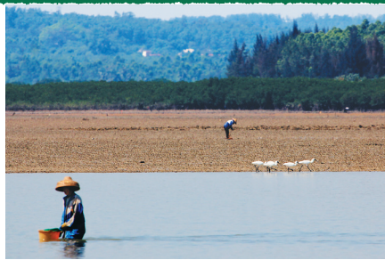
临高新盈红树林国家湿地公园。