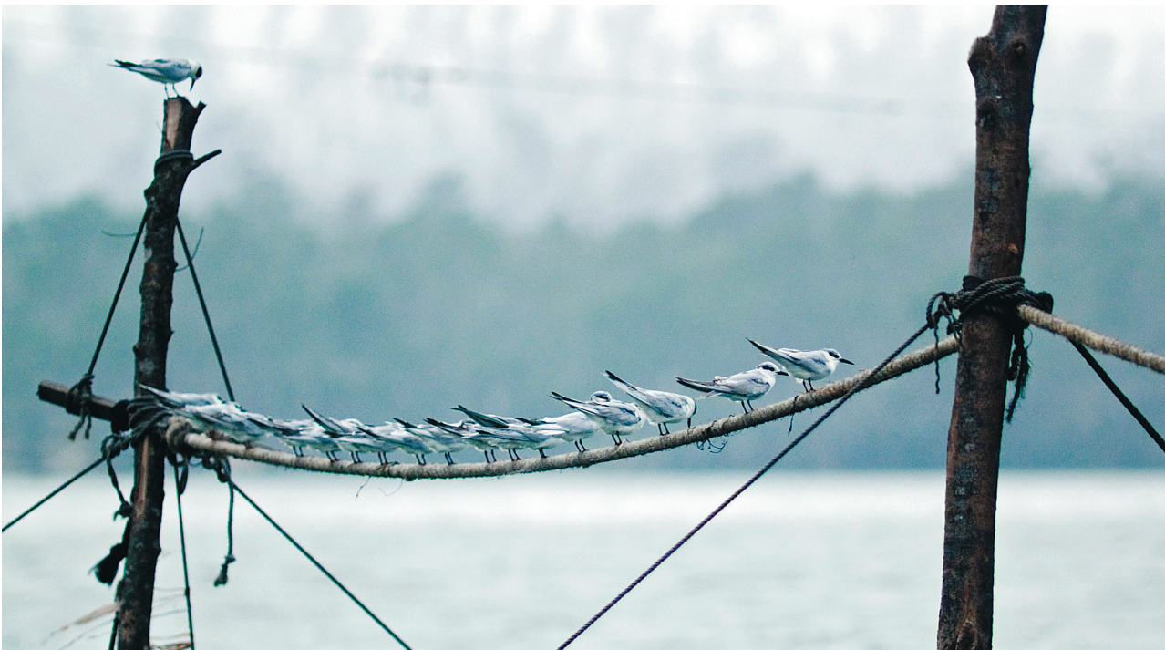
文昌八门湾红树林湿地里的须浮鸥。