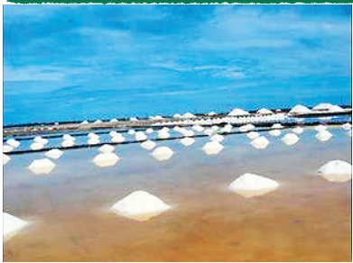
乐东莺歌海盐田湿地景观。