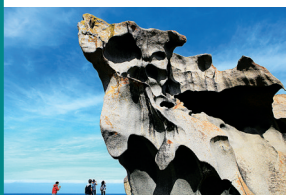
袋鼠岛上被风化的巨型岩石