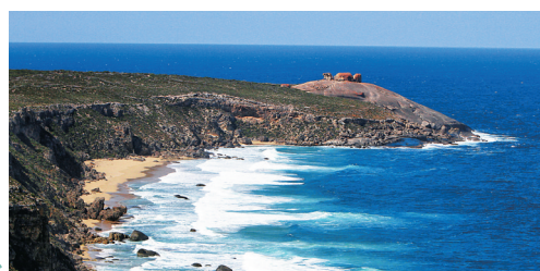
袋鼠岛的海蓝到令人心悸