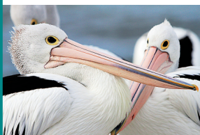
袋鼠岛上的动物“岛民”