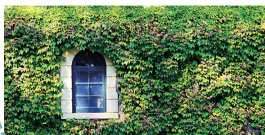
芭罗莎是全澳洲最知名的葡萄酒之乡

餐厅的菜式不仅美味,而且惊人的量足,德国香肠、猪脚满满当一大盘,看得我瞠目结舌。搭配肉肠怎能少了德国啤酒。Hahndorf酒店餐厅常年提供进口Hofbrau啤酒,包括黑啤。热情的餐厅服务员,穿着旧式农庄服饰,举着大扎啤酒穿梭于餐桌之间,还不忘对目之所及的每个顾客报以微笑。大口吃肉,肆意喝酒的巴伐利亚风情一餐,令我在汉多夫德国村短暂的乡间生活无比酣畅。以至于酒足饭饱后在街上游览画廊、手工艺店和各式纪念品店时,有点刹不住车的花了不少银子。