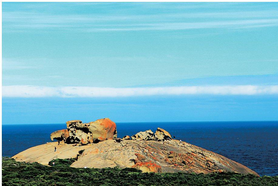
12月的南澳大利亚正值夏季,阳光充沛、海水正蓝

坐上离开袋鼠岛的飞机,我脑子里又想起之前那个朋友说的话,心想上帝可真会挑地方,把自己的动物园设在这么个绝美的岛上,真庆幸于他的慷慨,这动物园还对外开放。