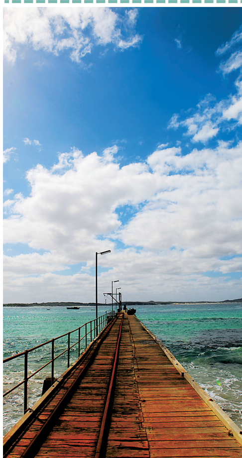
来到袋鼠岛,应该放慢脚步享受美景