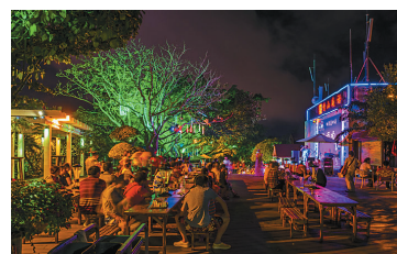
火树银花，悠闲畅聊。