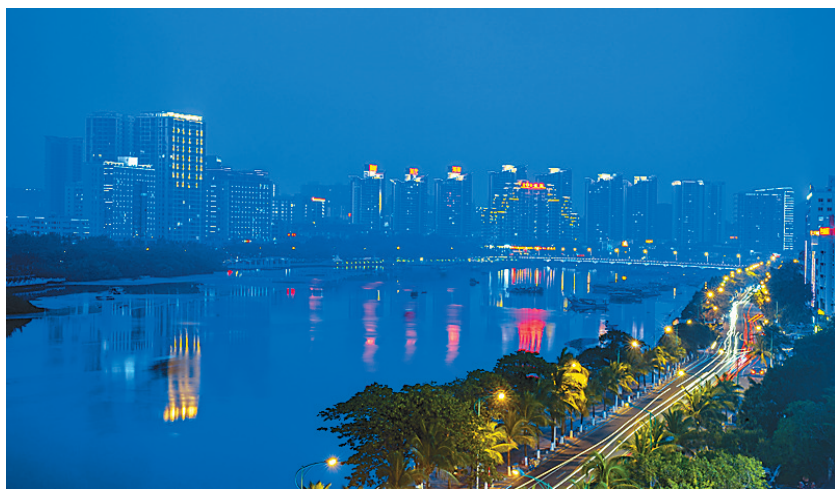
灯火辉煌的鼓楼大厦倒映在平缓的河流中。