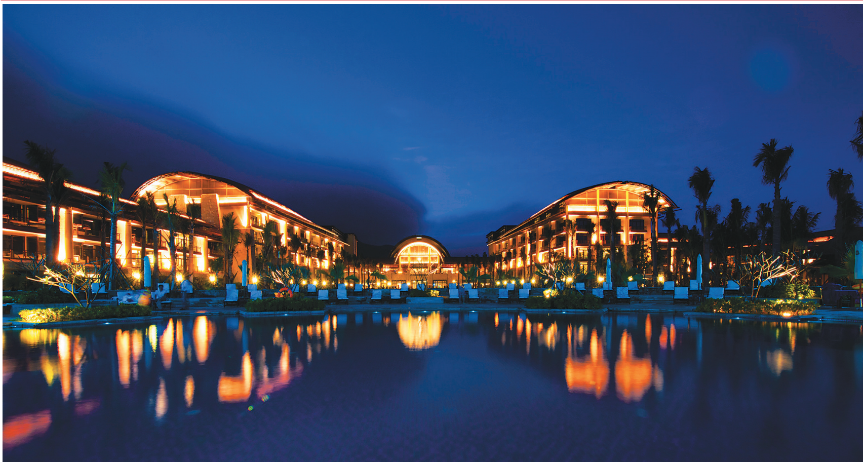
三亚一酒店的迷人夜景。