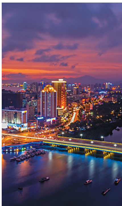
晚霞犹在，华灯已上。