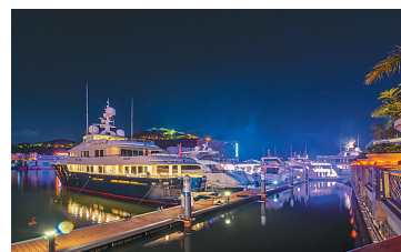
夜已深，灯火仍旧灿烂。