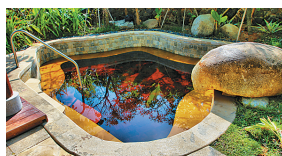
海棠湾9号咖啡温泉。