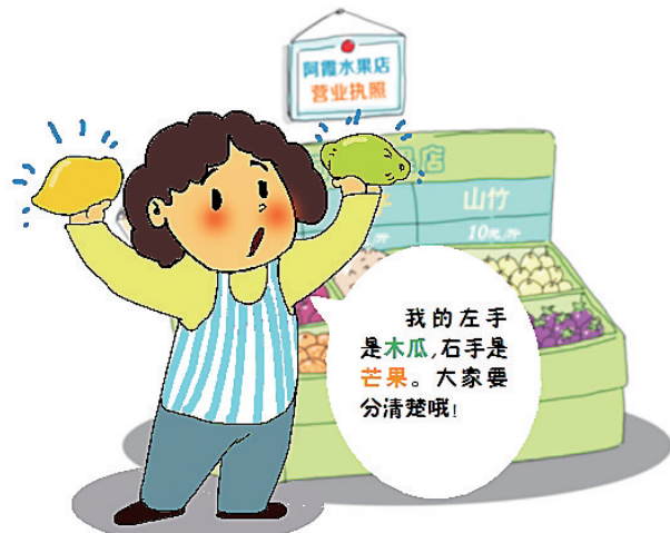
经营水果要分类摆放,不同种类但外形颜色相似的水果不能放在一起销售,以免误导消费者。