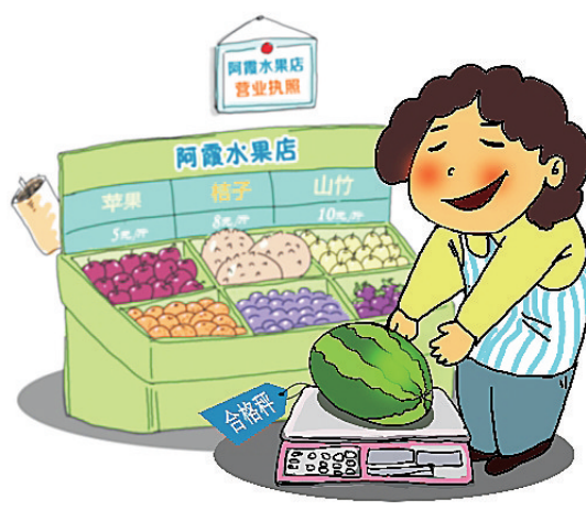
使用经质量技术监督部门检测合格的电子秤,不得擅自使用其他秤具。