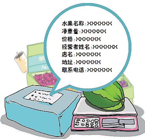
实行“裸称”制度。经营者销售水果时(含整箱销售的水果),一律以水果净重量进行结算。整箱打包的水果,要在外包装上明确标明水果名称、净重量、价格、经营者姓名、店名、地址以及联系电话。