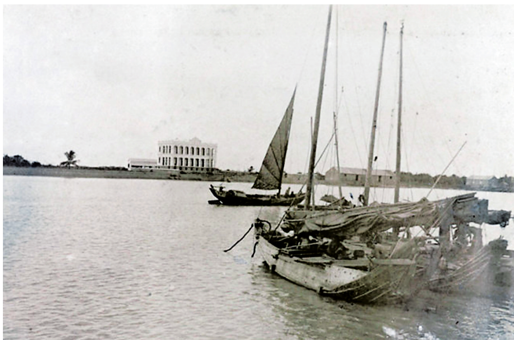
昔日位于海口海甸岛海甸溪岸的法国领事馆。