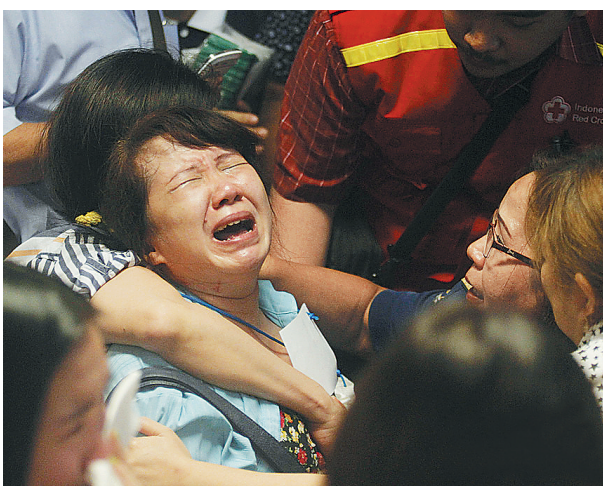
↑失联亚航 QZ8501 航班乘客家属在得知印尼搜救队发现飞机残骸后悲痛欲绝。