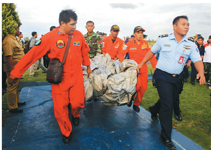
↑印尼空军机组人员正抬着疑似失事客机的紧急滑梯。