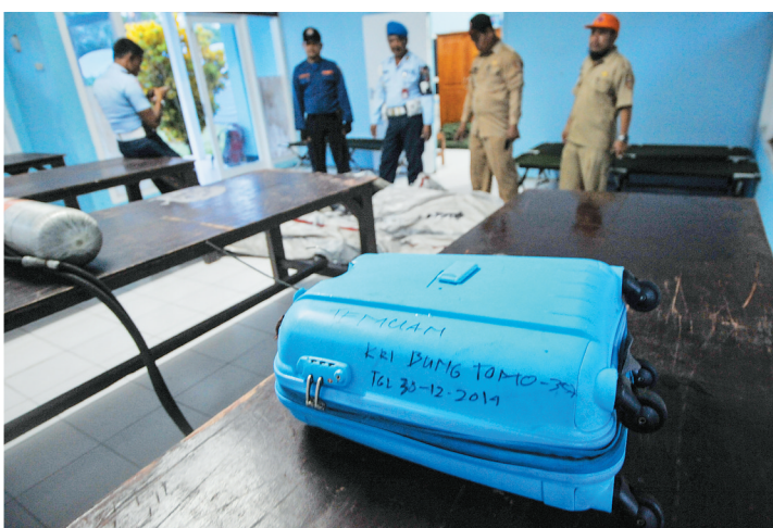
↑疑似来自亚航失联客机的物品。