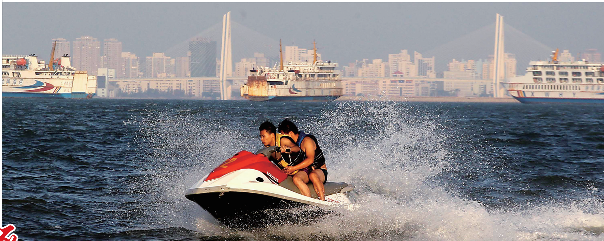
在不断完善旅游法规的支撑下,我省旅游业发展势头强劲。图为游客在海口假日海滩游玩。