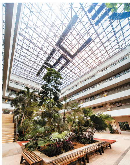
海南生态软件园孵化楼。

根据工信部发布的2013年中国信息化发展水平指数排名，我省位居第12名。我省颁布了《海南省信息化条例》，基础网络和通信应用快速发展，新增网络光纤约40万芯公里，省内风景区实现光纤全覆盖，全省互联网用户已突破750万户；建成全省电子政务网上审批信息系统，省政府门户网站全国评比名列第五；建成地理信息、农村医疗、瓜果质量监