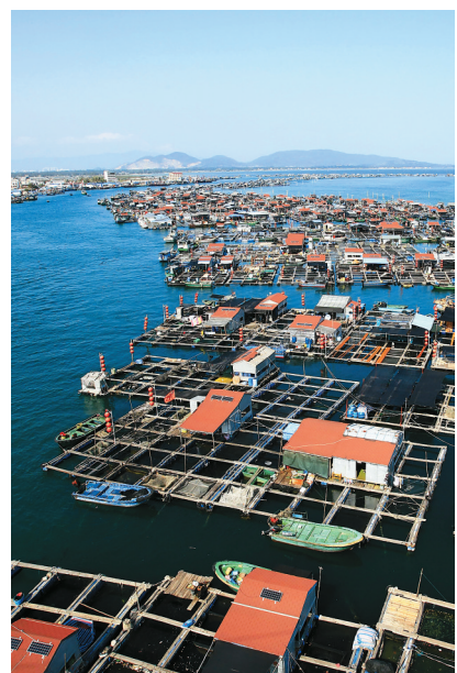
陵水新村渔排。