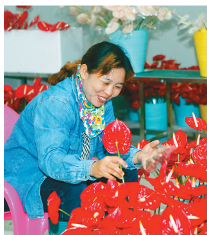
东方市小岭农民专业合作社社员,正在分拣红掌鲜切花。