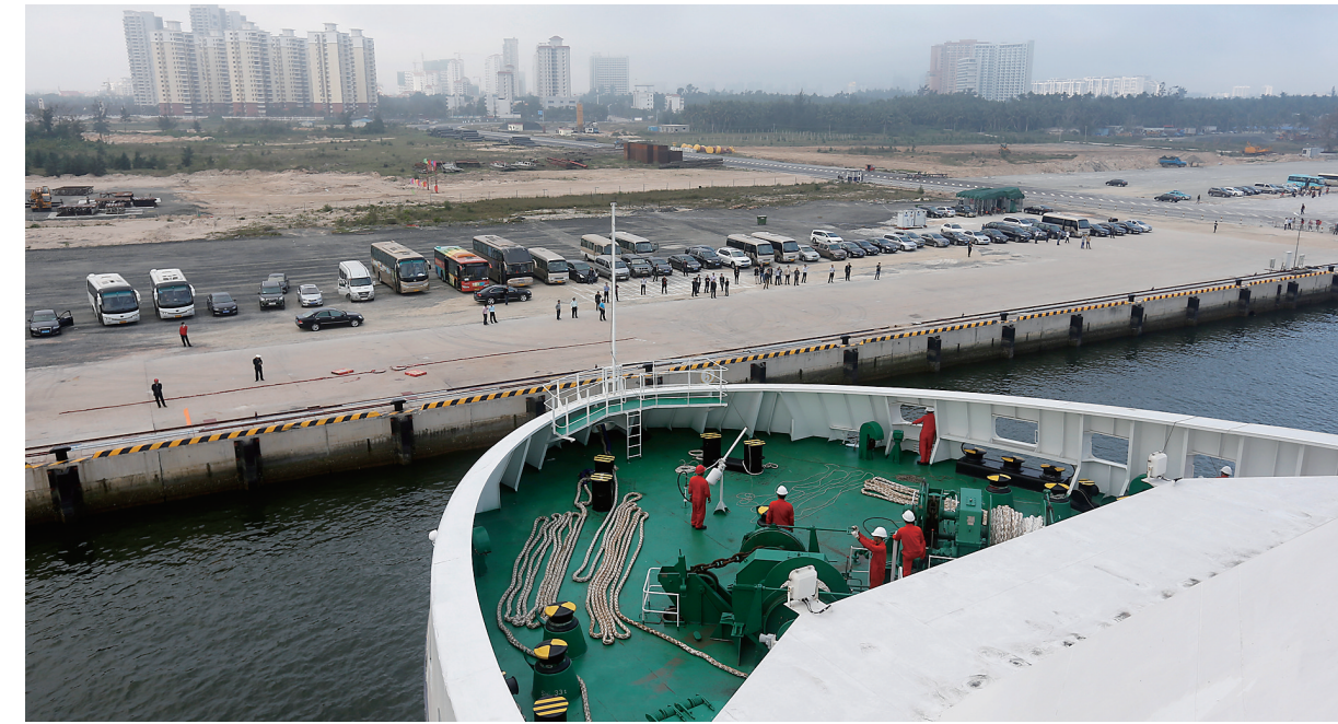
1月7日,“三沙1号”交通补给船顺利驶抵清澜码头,圆满结束首航补给任务。

据悉,去年10月中国红树林保育联盟(CMCN)发布《中国濒危红树植物红榄李调查报告》称,濒危红树植物红榄李目前国内仅剩余14株,全部分布于我省。