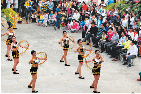
1月6日,五指山市文化下乡暨非遗保护成果“四进”展演在五指山水乡牙排村演出,为村民们献上一场精彩的表演。