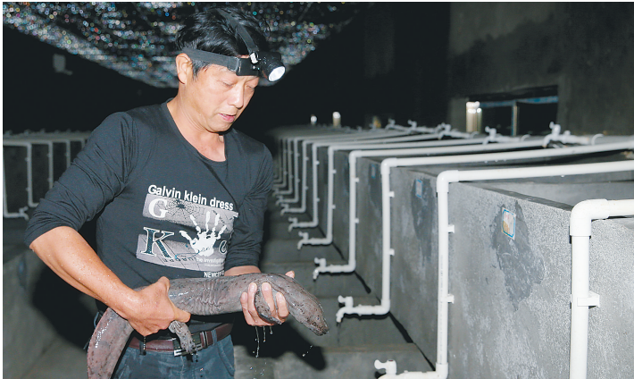
一月六日，养殖技术人员在检查大鲵生长情况。本报记者 苏晓杰 摄

2010年初，儋州远都农业开发有限公司从湖南张家界引进66尾世界上现存最大的也是最珍贵的两栖动物——大鲵，俗称娃娃鱼。公司建立了海南热带娃娃鱼养殖示范基地，经过5年时间的饲养证明，大鲵可以在海南亚热带地区生长繁殖。迄今为止该基地已繁育存栏大鲵子二代400多尾，2015年底可繁育出10万尾左右。目前，国内市场大鲵每市斤价格高达1200元左右。该公司已具备深加工能力，可生产娃娃鱼营养面、娃娃鱼蛋白粉、娃娃鱼美容护肤系列产品及医药等产品。