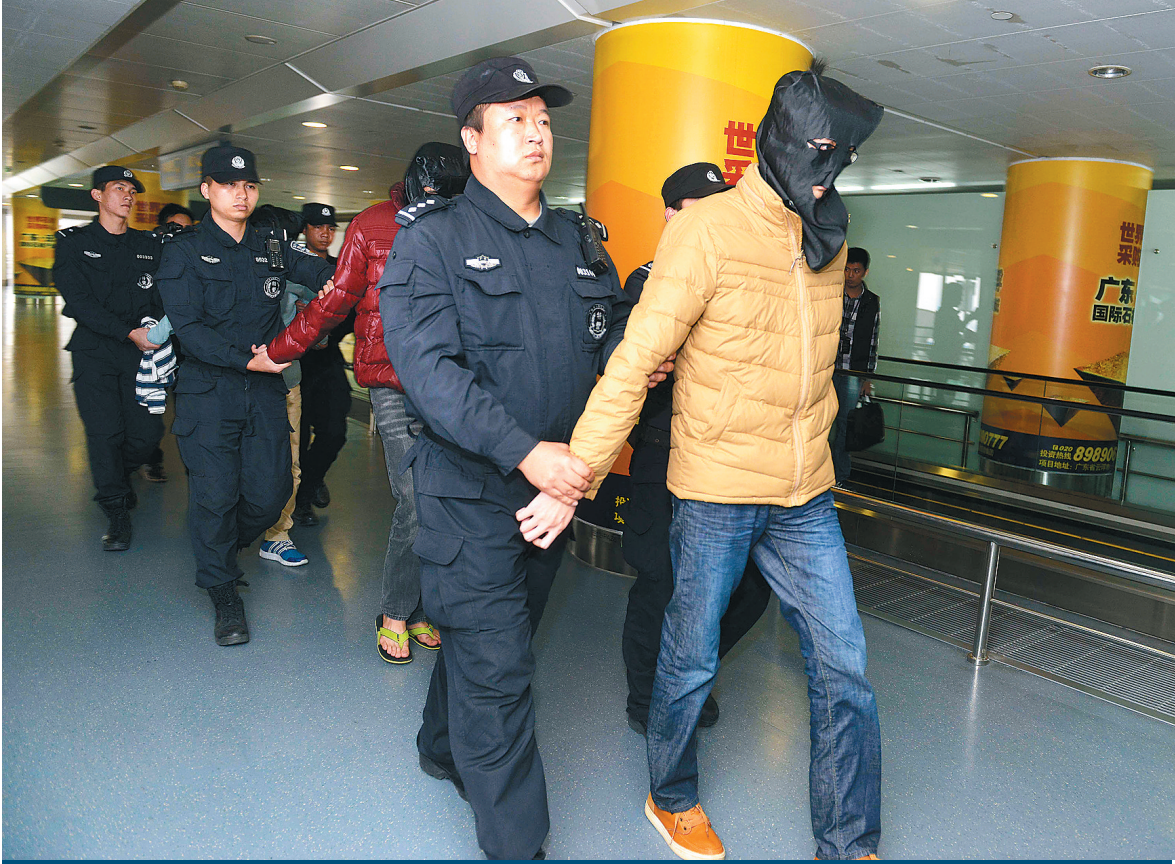
2014年12月16日,潜逃泰国的广东犯罪嫌疑人郑某等7人被押解回国。