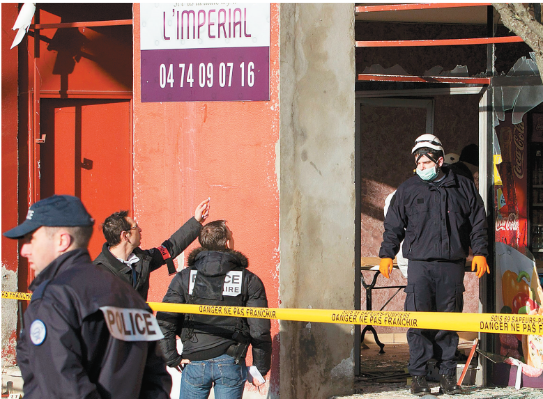
1月8日,在法国东部罗讷省索恩河畔自由城,警方查看爆炸现场。

《沙尔利周刊》遇难者中许多人年事已高,从业多年,算得上法国漫画界的前辈。以下是媒体公开的部分遇难漫画家。