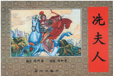
《冼夫人连环画》封面