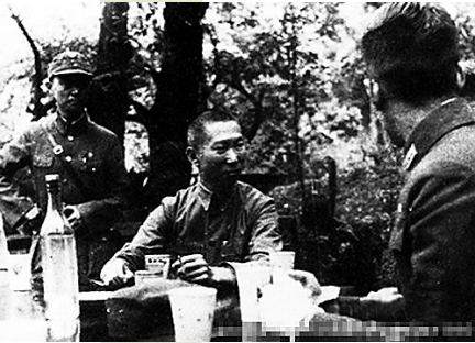
长沙会战中的薛岳(中)。