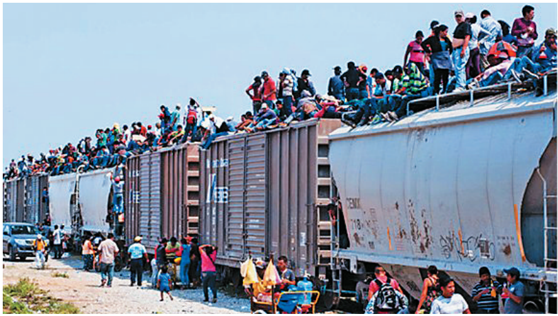
墨西哥如今几乎没有客运铁路(资料照片)。

针对墨西哥高铁重新招标正式启动一事,中国外交部发言人洪磊15日在例行记者会上表示,中方鼓励中国企业参与墨西哥有关高铁合作项目,并希望墨西哥政府为这些企业提供公平竞争环境。