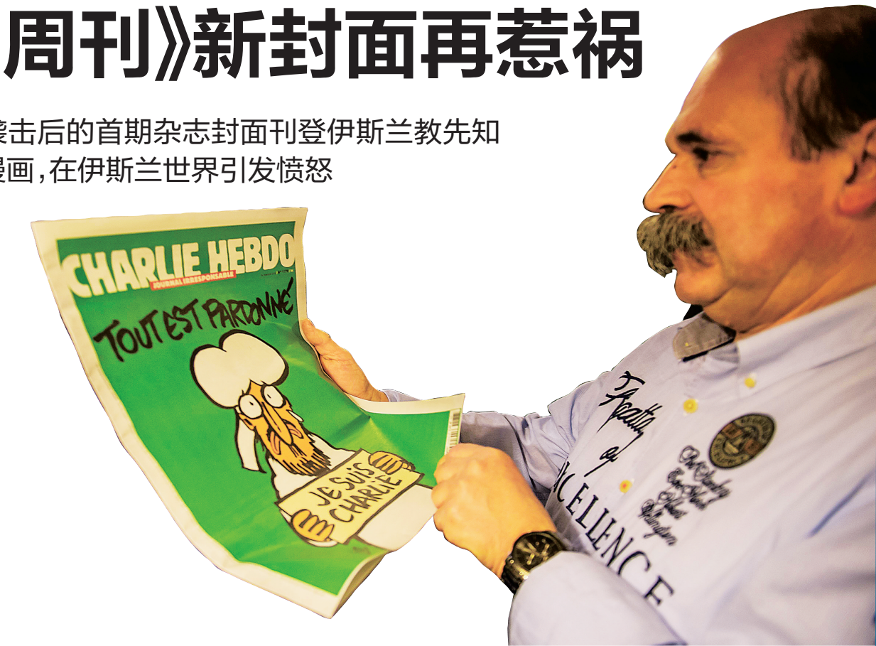
1月14日,在法国敦刻尔克,一名男子阅读遭袭击后首期的《沙尔利周刊》。

即便如此,依旧引发抗议。《沙尔利周刊》不应该在我们的国家发行”,成为微博客网站“推特”土耳其版当天热门话题。数十名穆斯林14日晚在土耳其